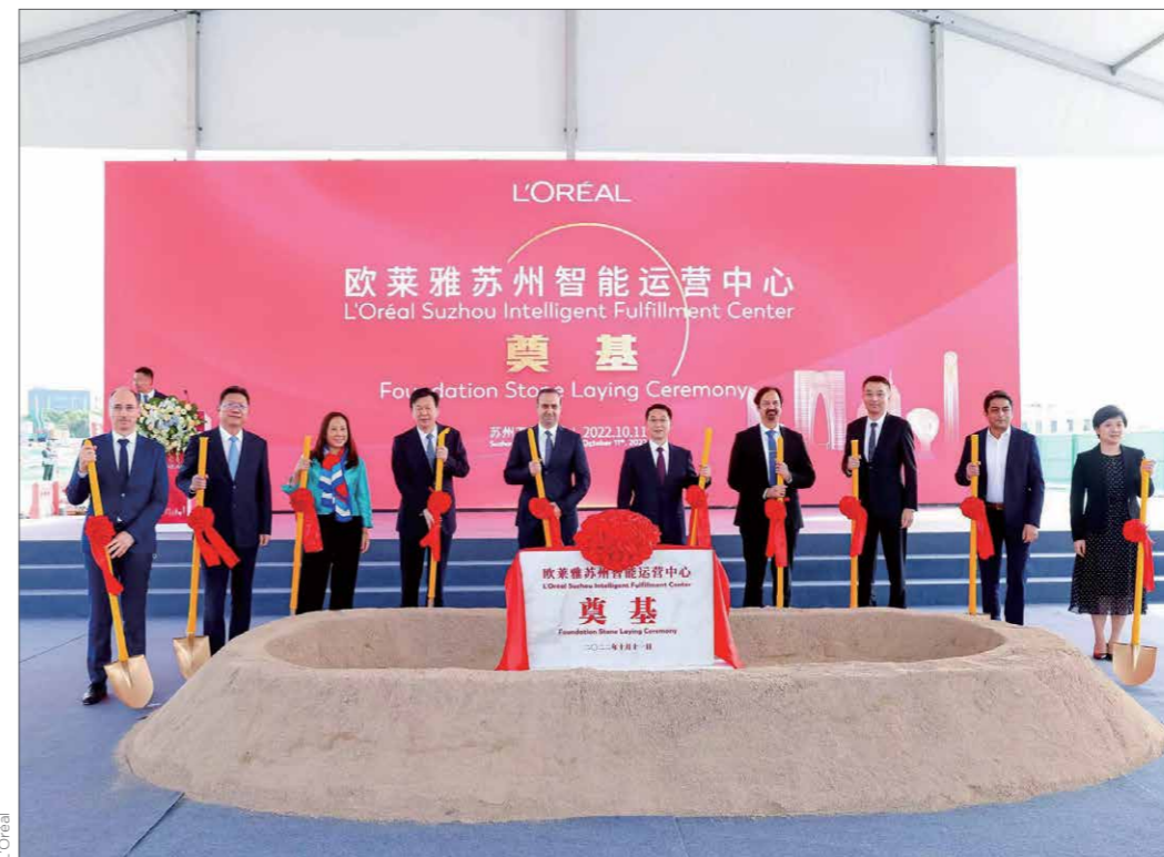
La Cérémonie de pose de la première pierre du premier centre d'opérations intelligent au monde auto-construit par L'Oréal 欧莱雅全球首家自建智能运营中心奠基仪式