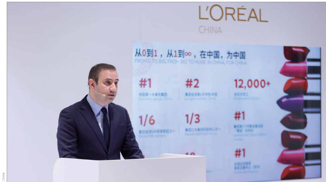
Le président de L'Oréal Asie du Nord et PDG de la Chine, Fabrice Megarbane a prononcé un discours lors de la réunion annuelle de communication de la stratégie de développement du 25e anniversaire de L'Oréal Chine 欧莱雅北亚总裁及中国首席执行官费博瑞在欧莱雅中国25周年发展战略年度沟通会上发表演讲